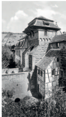
Maulbronn, westl. Kloster um 1900.

Anmeldung erforderlich beim Stadtarchiv Maulbronn, ehlers@maulbronn.de oder per Post unter Stadtarchiv Maulbronn, PF 47, 75429 Maulbronn