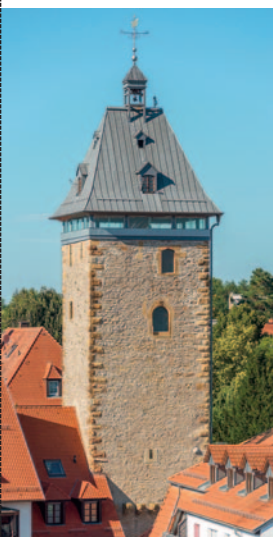
Pfeifferturm in Bretten.