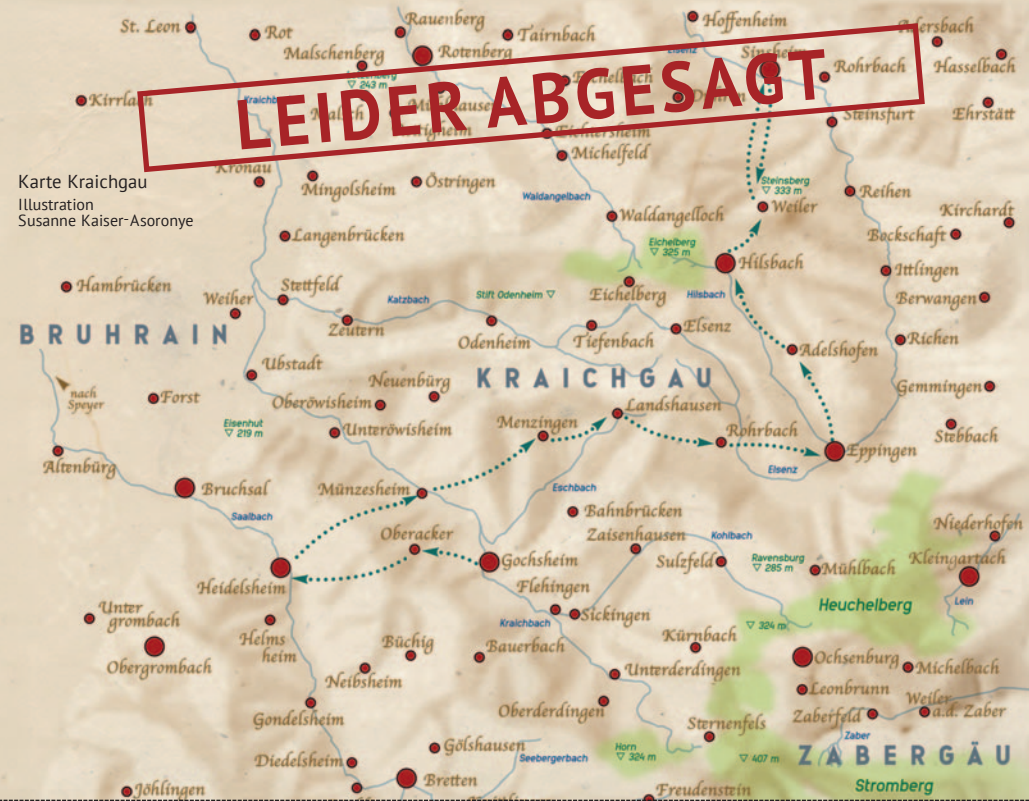
Karte Kraichgau Illustration Susanne Kaiser-Asoronye