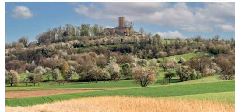
Burg Steinsberg, Kompass des Kraichgaus im April 2022.