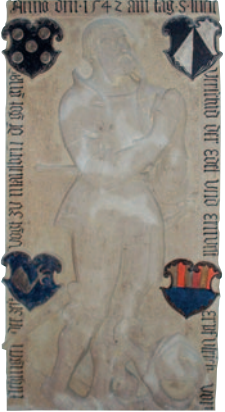
Epitaph Erpf Ulrich von Flehingen, 1542.